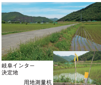
岐阜インター 決定地

西隣の糸貫町では早くも道路橋脚が2基、3基と形を現しています。当地域では2020年開通といわれていますが、一時も早い完成を望みます。