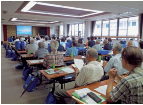
黒野調査区では、121区画に分類され(マンションも含む)、調査員は1~2区画を担当した。なかには4区画の調査員もありました。

五年毎の国勢調査が今年行われ、黒野自治会連合会から八十四名の方が、調査員として委嘱され協力を願いました。