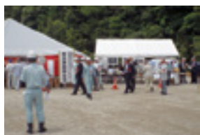
平成28年6月20日(月) 待望の東海環状自動車道 岐阜市城田寺地内においての工事安全祈願祭が開催されました。

最後になりましたが皆様のご健勝ご多幸をお祈り申し上げます。新年のご挨拶と致します。