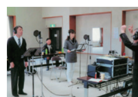
賛歌「あゝ黒野城下町」発表会

昭和の時代には、城跡や城下町を歌った曲が多くありました。来年のNHK大河ドラマ「麒麟がくる」では岐阜城が脚光を浴びることになりますが、黒野もふるさと発信をしましょう。