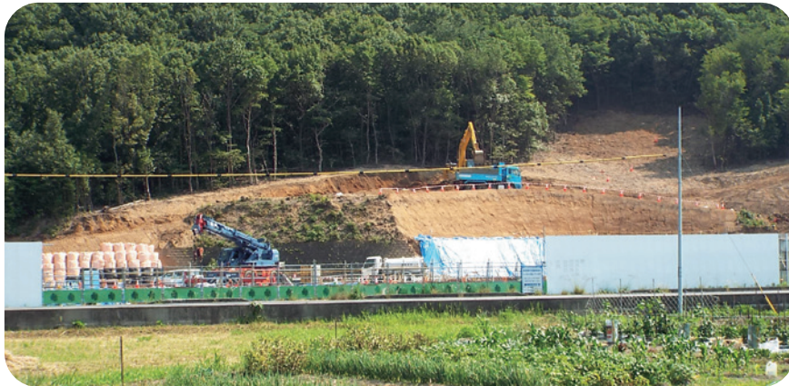
御望山トンネル西坑口着手