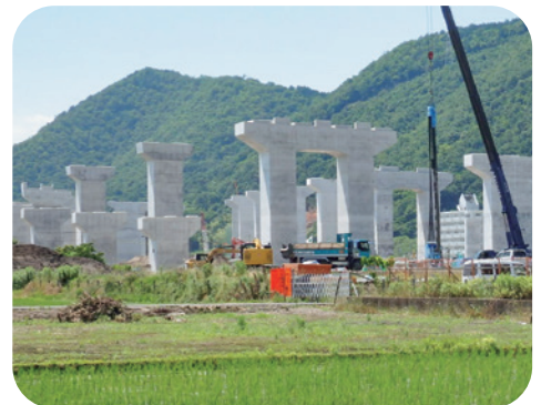
東海環状道(仮称)岐阜インター西 洞付近橋脚群