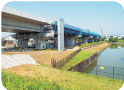
正木大橋(仮称) 共和町遊水池付近