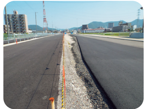
岐阜大学病院線(折立付近)