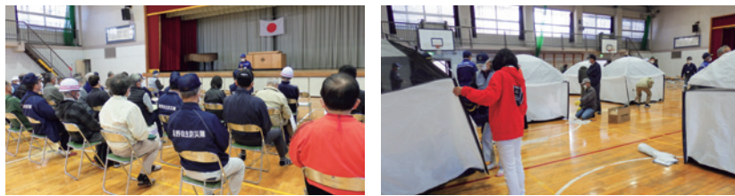
令和2年度 黒野地域(東ブロック)避難所訓練