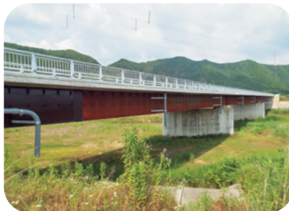
大学北大橋から岐阜市中央部へ(常磐方面)